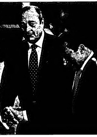
ياسر عرفات في اجتماعه مع أولبرايت في واشنطن